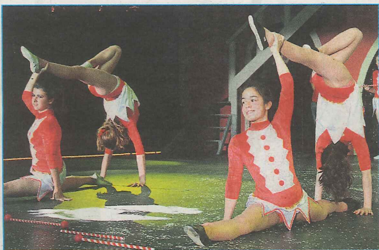
Au cours du spectacle, chacun donne le meilleur de lui-même.

Préparez-vous à en prendre plein les yeux. Cette année les Cadets' Circus proposent un voyage à la découverte des divers carnivals du monde : Rio, Nice, Dunkerque, Dublin, Venise, tous seront à l'honneur lors des 2 représentations, les samedis 24 et 31 mai à 21h au champ de foire d'Etréchy. Voilà maintenant des mois et des mois que musiciens, costumiers, entraîneurs, équipe technique et élèves ne ménagent ni leurs efforts, ni leur temps et s'évertuent à faire de cet événement le rendez-vous incontournable du printemps.