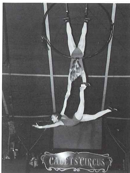
Eglantine et Clarisse.

représentations annuelles. Réunir, sur une même piste, un frais bataillon de 160 artistes adolescents, accompagnés par un orchestre de 15 musiciens et ce, pour deux représentations seulement,